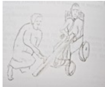
dessin n° 7