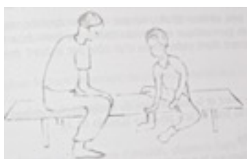
dessin n° 2

Se déplacer jusqu'à saisir une main de l'adulte ou un objet posé sur le banc (dessin n° 2).