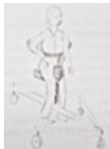
dessin n° 1

Au-delà de la nécessaire prise en compte d'éventuelles contre-indications médicales et de précautions à respecter dans certaines situations, la mise en œuvre du projet exige une adaptation des tâches. En premier lieu, il s'agit de prévoir les conditions matérielles. Ainsi, un enfant qui se déplace habituellement en fauteuil roulant à propulsion manuelle, ou bien assis sur une « flèche » (dessin n° 1), pourra peut-être, dans certains cas, évoluer avec profit hors de son engin de locomotion. Sa mobilité réduite et les contraintes auxquelles il devra faire face peuvent alors appeler un aménagement de l'environnement particulier à partir d'éléments qu'il faudra si besoin se procurer. Et des capacités de préhension manuelle limitées conduisent à privilégier certains objets.