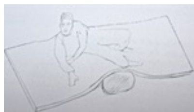
dessin n° 4

Passer par-dessus la « montagne » pour aller saisir la main de l'adulte ou un objet (dessin n° 4).