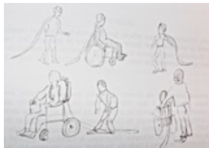
Dessin n° 9

Pour pallier l'incapacité de Juliette de toucher un camarade avec les membres supérieurs, l'adaptation suivante est prévue : chez les enfants qui tiennent le rôle de « souris », une bande de tissu est glissée derrière chacun des fauteuils roulants et dans le short ou le pantalon des enfants qui se déplacent debout. Elle est suffisamment longue pour traîner au sol. On considère qu'un joueur est touché quand un « chat » en fauteuil a roulé sur la traîne ou qu'un « chat » debout a posé le pied dessus (dessin n° 9).