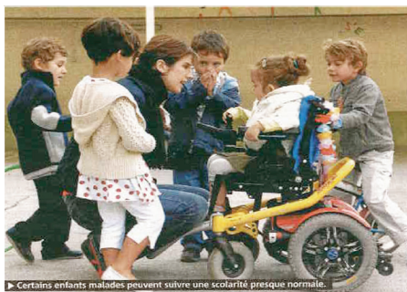
► Certains enfants malades peuvent suivre une scolarité presque normale.

des avancées thérapeutiques et technologiques au bénéfice de l'inclusion scolaire est convoquée par cette image, sans oublier l'évolution des modalités de prise en compte de ce public d'élèves par le législateur. On aperçoit d'autres enfants auprès de la jeune malade, et, parmi ces élèves bien visibles, se cache peut-être une situation de handicap invisible. L'évolution des publics handicapés ne cessant pas de se métamorphoser, l'époque permet de voir apparaître de nouveaux défis pour la scolarisation des jeunes porteurs de troubles des fonctions cognitives, de séquelles de traumatisme crânien ou d'accident vasculaire cérébral, pour ne citer que trois exemples. Autre lecture possible, un jeune autiste est peut-être présent et la transition qui voit ce trouble important du développement passer du statut de maladie à celui de handicap est un dossier capital de cette séquence au plan national.