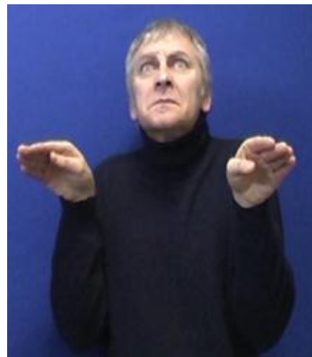
Figure 2 : Transfert personnel (TP) [TORTUE] 2

Remarque: même dans le cas de l'utilisation d'un signe lexicalisé, le recours simultané au transfert personnel est possible, ainsi dans la figure 1 le personnage transféré est un homme découvrant la petite tortue et l'expression sur le visage du signeur est bien celle de l'homme et non pas comme dans la figure 2 celle de la tortue.