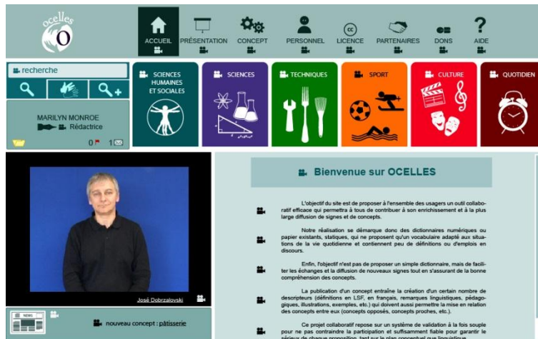
Figure 3 : Copie d'écran de la page d'accueil 8