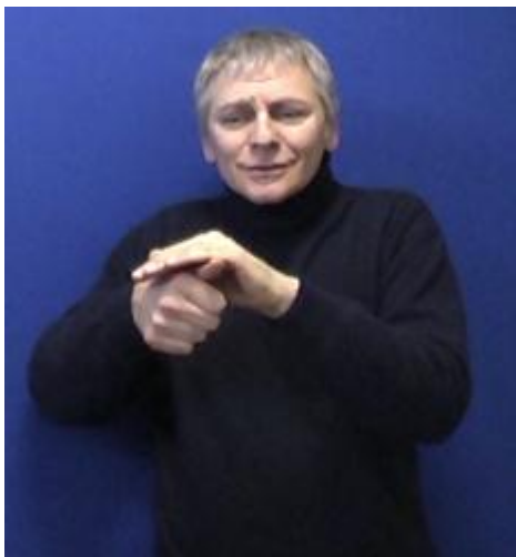
Figure 1 : Signe lexicalisé [TORTUE]

Dans l'exemple suivant, le locuteur utilise à droite le signe lexicalisé [TORTUE] alors qu'à gauche, il en adopte la posture, les mimiques et les mouvements. On notera entre autre la position et la forme des mains qui rappellent les nageoires et en figurent le mouvement et le regard exprimant, à la fois la peur de l'animal et la position de la tortue par rapport à l'objet regardé, situé en face d'elle, vers le haut.