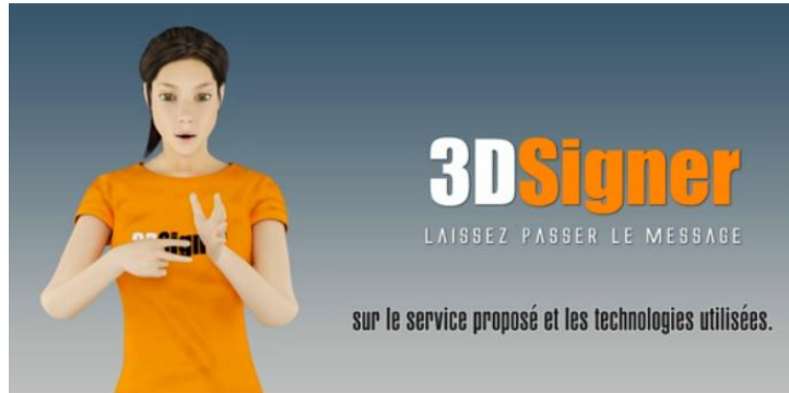
Figure 5 : solution 3DSigner proposée par Websourd

synthèse permettrait également aux utilisateurs de visionner un signe sous plusieurs angles en faisant pivoter le personnage virtuel à volonté, pour une meilleure perception et compréhension d'un signe ou d'un discours, ce que ne permet pas actuellement une simple vidéo. La possibilité d'un paramétrage personnalisé adapté à différents types d'utilisateurs est également une piste à envisager. De nombreuses pistes de recherche laissent espérer la production à plus ou moins long terme d'outils qui vont de simples applications à usage pédagogique au traitement automatisé de la LSF, mais la perspective de l'interprétation automatique d'une langue écrite vers une langue signée et réciproquement n'est pas encore d'actualité (Segouat et al., 2008).